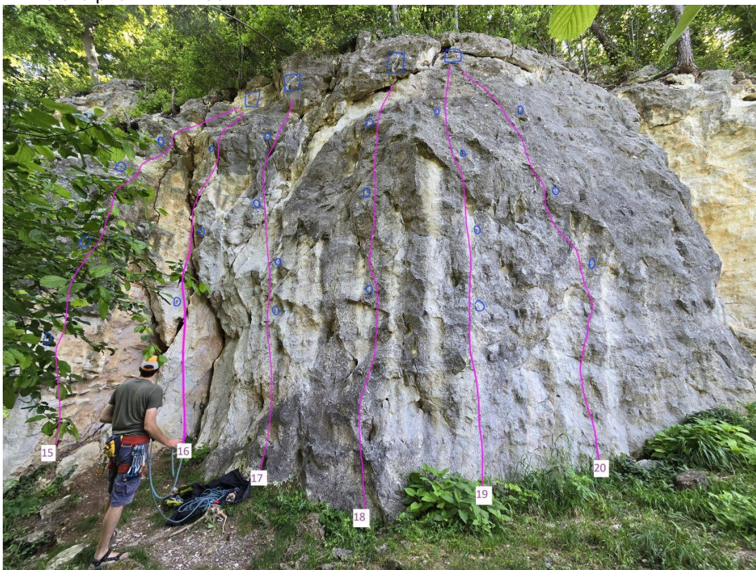
15. Za dva špricera